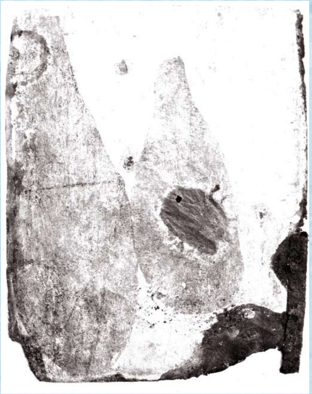
noyaux 2, Stéphanie Ferrat